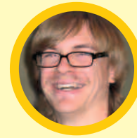
DER SCHÖPFER „Wiederhole nichts, was Du schon kannst!“