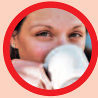
DER KOMMUNIKATOR „Lass uns darüber reden!“