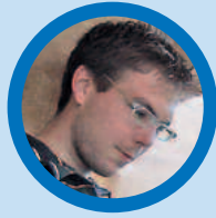
DER ANALYST „Wenn es logisch ist, ist es richtig!“