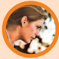
DER WAHRNEHMER „Schau genau hin!“