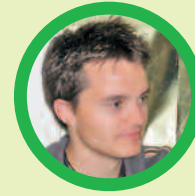
DER VERWALTER „Vorsicht!“